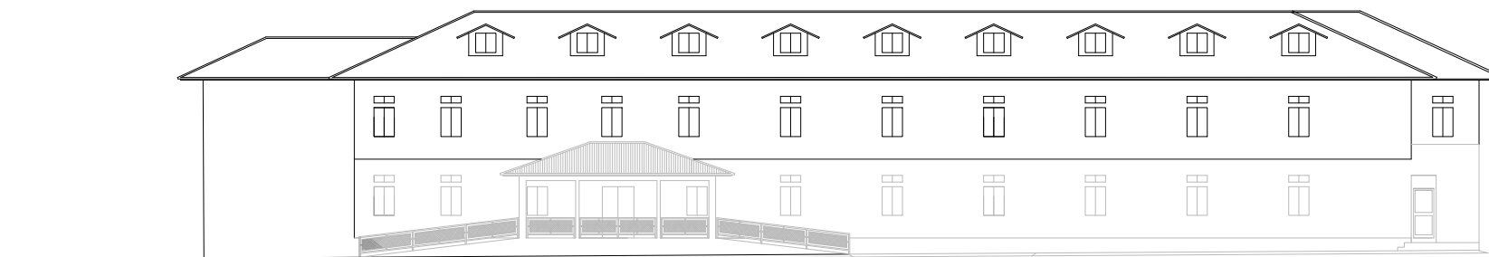
FACHADA Esc. 1: 100